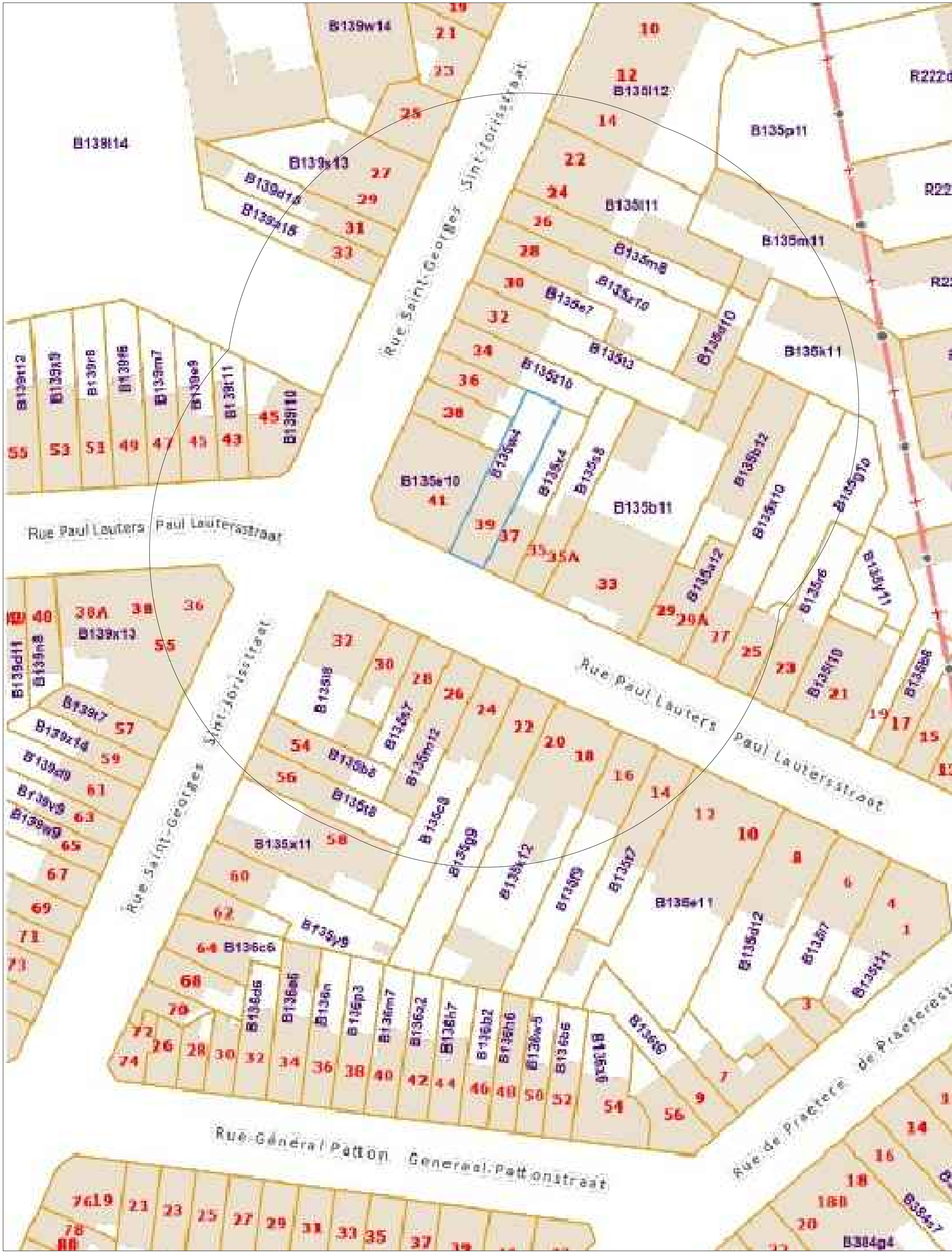
PLAN DE SITUATION ECH 1/500