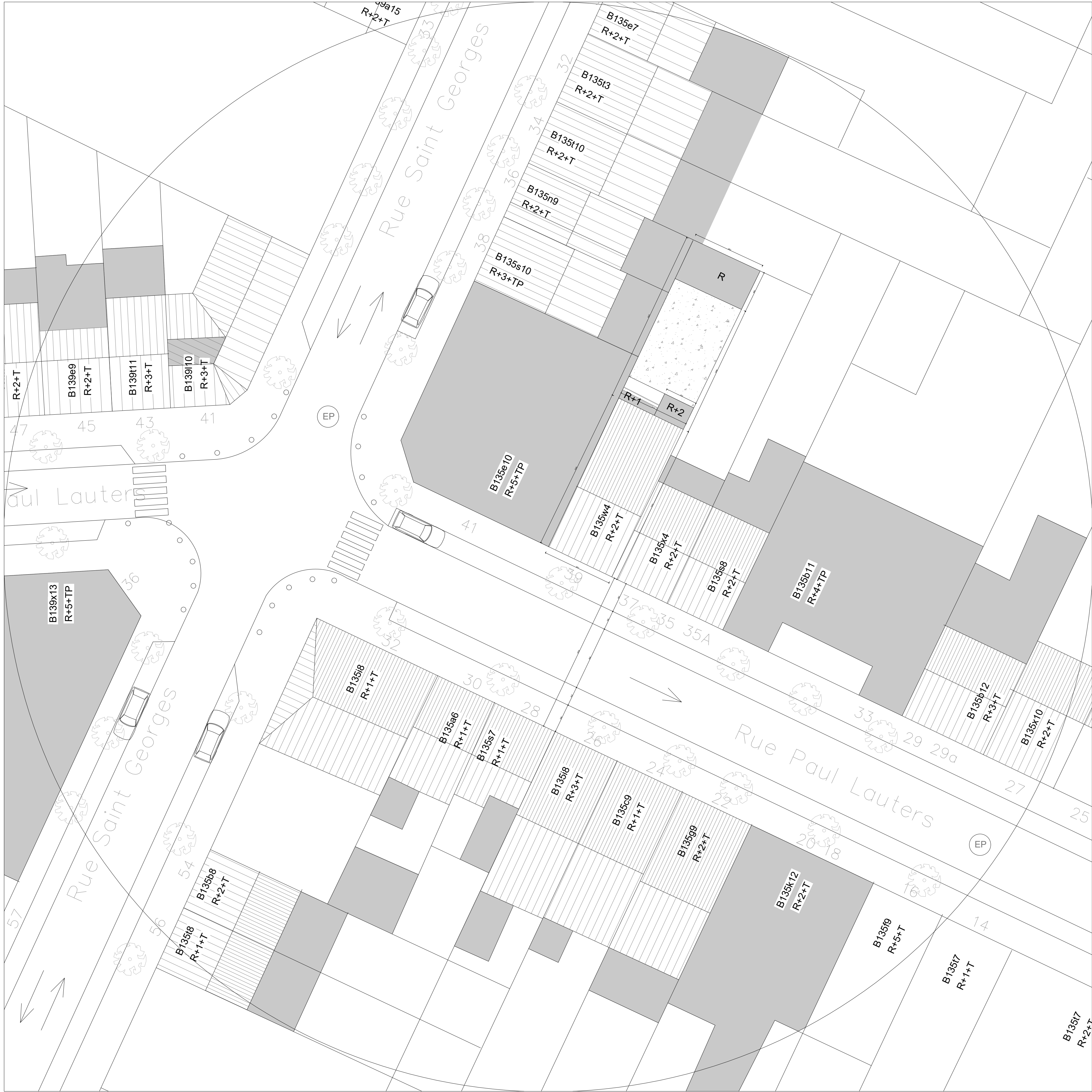
PLAN D'IMPLANTATION PROJETE ECH 1/200